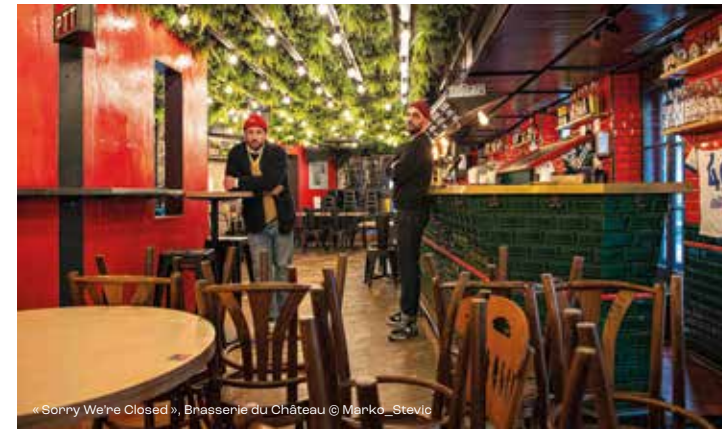
« Sorry We're Closed », Brasserie du Château