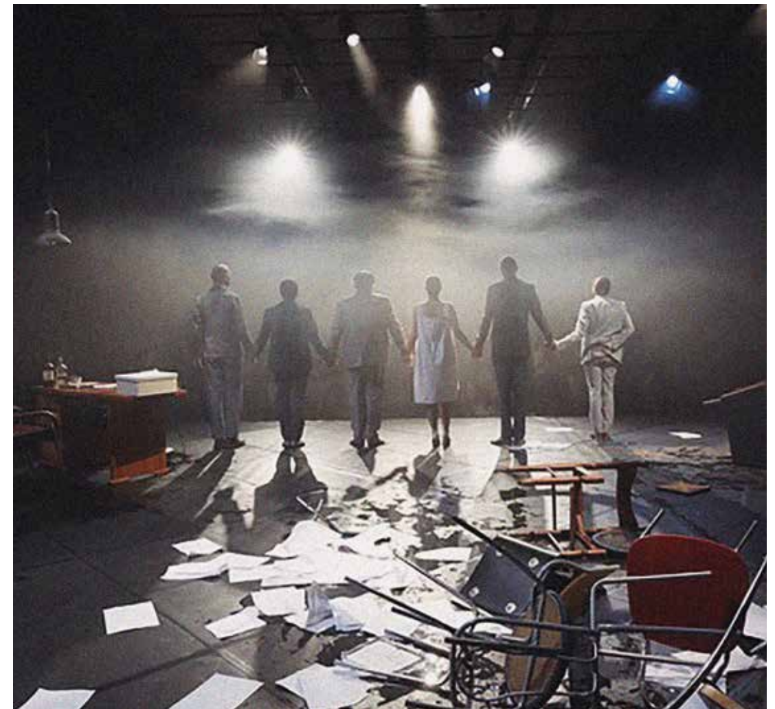
Final de Hot House de Pinter réalisé en juillet-août 2014 au Théâtre de l'Orangerie à Genève par la Compagnie Cap10.

Il n'y en a plus depuis quelques années que pour l'immédiat et le concret. La fiction semble en quelque sorte avoir fait partie des victimes du Covid. Sans elle plus de récits ni d'histoire de quelque portée, plus de transposition et donc plus rien qui n'intéresse le plus grand nombre parce que ça lui parle de lui. La satellisation du métier en auto-entreprises ravit sans doute les tenant·e·s de la pensée économiste, mais elle prive bon nombre de spectateur·rice·s des grands récits. Sinon ceux servis par les pays qui nous environnent et savent mettre les moyens pour obtenir des productions de haute valeur symbolique qui parlent aux gens de leur rapport à la commu-