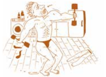
« Confessions Confinées », extraits. © Sarah Najjar

Il passe ses journées à faire de la muscu en sous-vêtement dans l'appart.